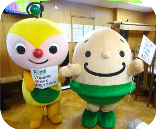
森の教室のキャラクターどんぐりくん（右）とファミリーマート環境キャラクターのエコロン（左）

国土緑化推進機構が「緑の募金」を活用して主催する「森の教室」は「森の教室～どんぐりくんと森の仲間たち～」のキャラバン隊が幼稚園や保育園を訪れ、森の大切さをこどもたちに伝えるプロジェクトです。園内に皆で植えたどんぐりを、卒園し小学生になってからも様子を見にくる子もいるそうです。