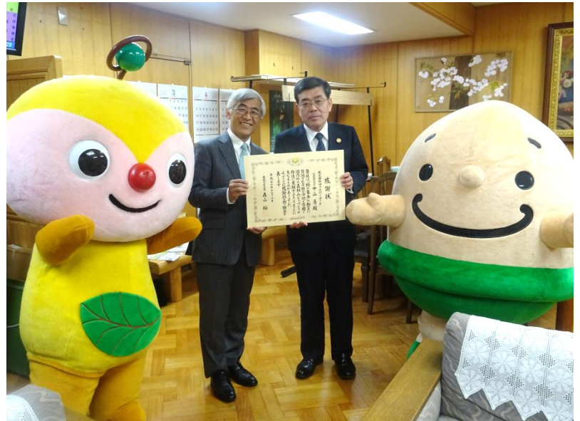
林野庁 今井 敏長官（右）とファミリーマート 北村 喜美男管理本部長（左）

贈呈式当日は「森の教室」で大活躍中のどんぐりくんとファミリーマートの環境キャラクター・エコロンも駆けつけてくれました！